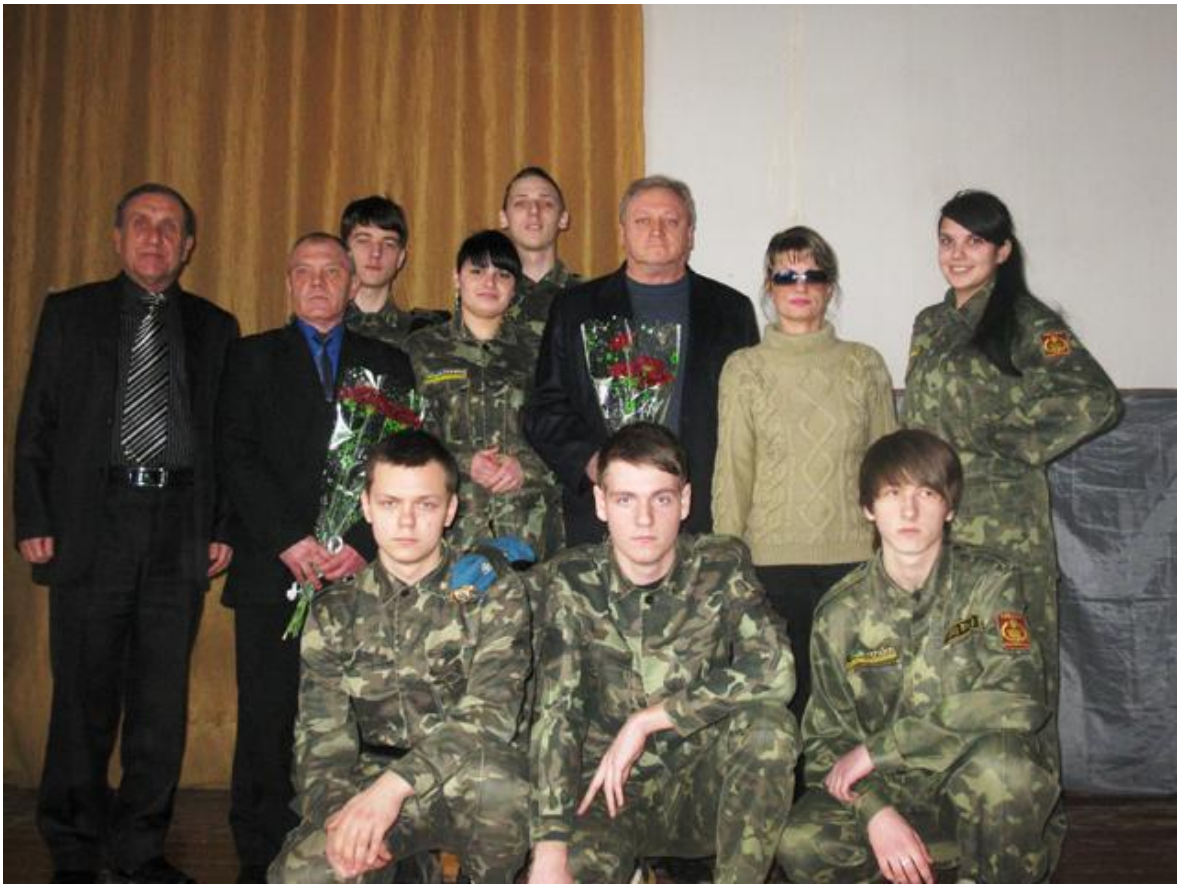
Представники учнівського самоврядування поклали квіти до пам'ятника воїнам-афганцям.