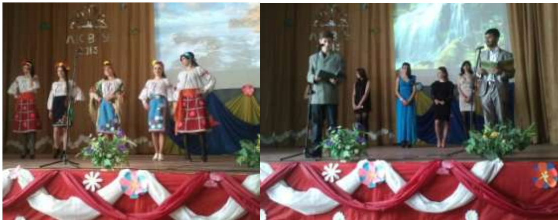
Голова учнівського самоврядування

20.03.2015 - представники культурно-масової комісії надали допомогу у підготовці та проведенні заходу «Міс ВПУ – 2015», присвяченому дівочій красі та молодості. Конкурс проходив серед дівчат училища. Усі отримали призи та заслужені титули.